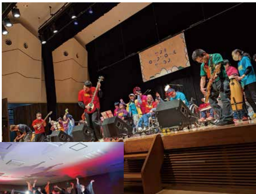
▲平成バンド サヌキロックンロールサーカス

今年度は新しい自主製品づくりとして、「ジェスモナイト」という特殊な樹脂を使ったマスコットや名刺サイズの角丸加工メモ用紙の制作を開始しました。利用者さん達の手で丁寧に制作された商品は定期的に開催されるバザーで販売しています。