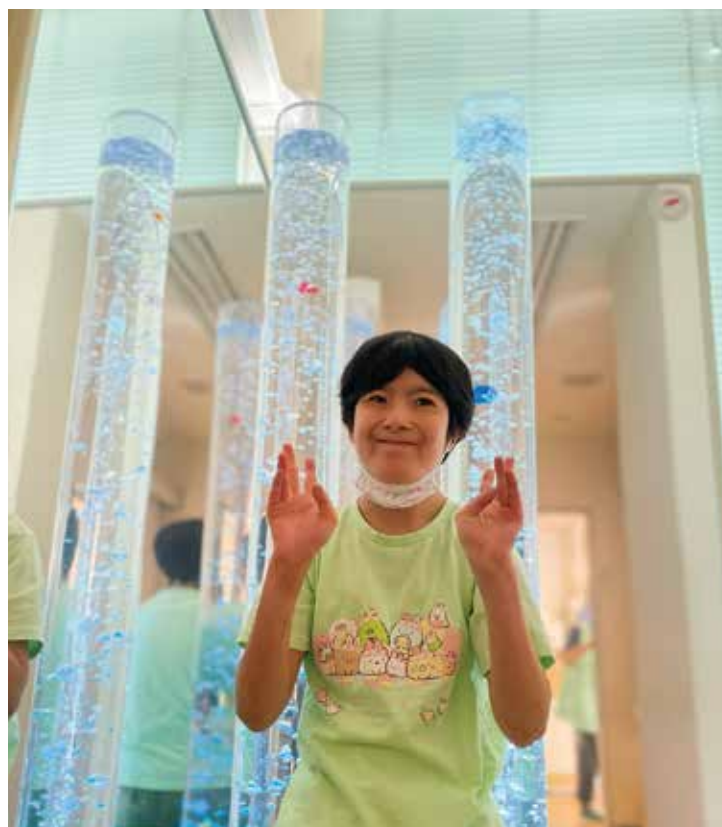
▲スヌーズレンルームはお気に入りの場所♡

スヌーズレンを導入！ 赤い羽根共同募金様からの助成を頂き、今年の7月よりスヌーズレンを導入しました。 スヌーズレンとは、光や音、香り、触覚といった感覚を刺激する多様なツールを通じて、利用者さんが心穏やかに過ごせるよう設計された多感覚室です。リラクセスできる空間の中で、それぞれのペースに合わせて心地よい刺激を感じること、集中力の向上、コミュニケーションの促進など様々な良い影響が期待できます。 スヌーズレンの導入により、利用者さん一人ひとりの状態やニーズに合わせた、より質の高い支援を提供できるようになりました。この新しい環境が、利用者さんの日々の生活に彩りと安らぎをもたらすように支援してまいります。ありがとうございます。