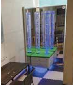
▲(社福) 香川県共同募金会様 スヌーズレン