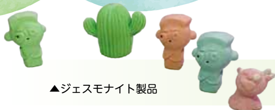
▲ジェスモナイト製品