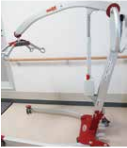
▲(財) 平井奉仕会様 モーリフト