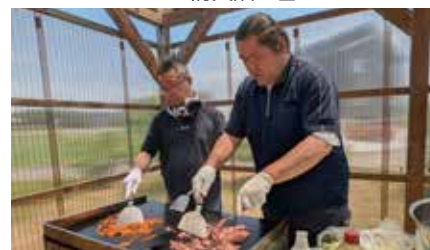
▲朝日つばさ交流会