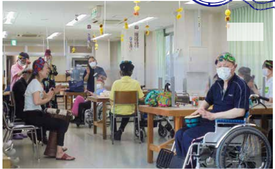
▲▼打楽器に合わせてウォーキング