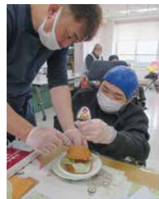
▲月に1回のお楽しみ会♪