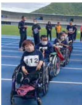
▲全国障害者スポーツ大会 選考会