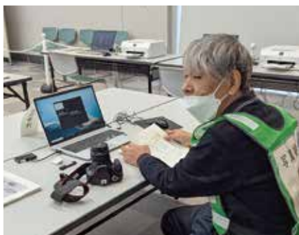
▲障害者技能競技大会（アビリンピック）