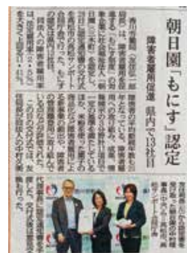
▲四国新聞 2025年8月30日掲載

今後も、障がい者の方々への一人ひとりの特性に応じた仕事づくりを進めるとともに、すべての職員が働きやすい職場環境づくりを目指し、障害者雇用のさらなる推進に努めてまいります。