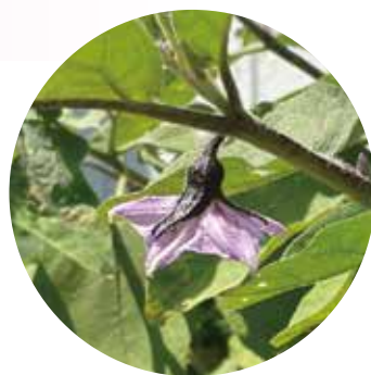
朝日平成園のプランターで すくすく育っています

利用者さん一人ひとりが笑顔で充実した毎日を送れるよう、温かみのある支援と工夫を凝らした活動を提供しています。