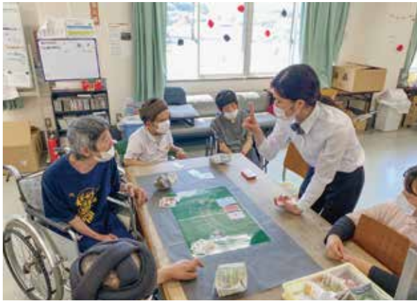
▲▼初めての試み カジノ大会