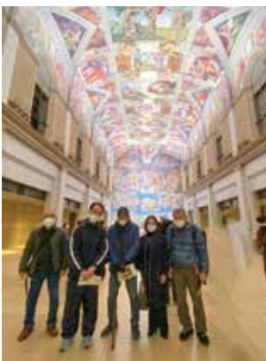
▲徳島日帰り研修旅行（大塚美術館）