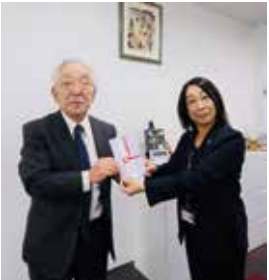
▲(社福) 三木町 社会福祉協議会様