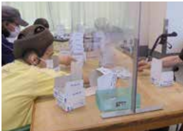
▲お仕事もがんばってます！

これからも、利用者さんに安心して楽しく過ごしていただけるよう支援を続けてまいります。