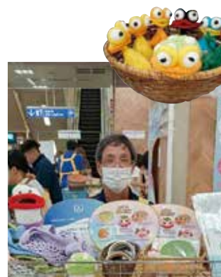
▲バザー・マルシェ参加