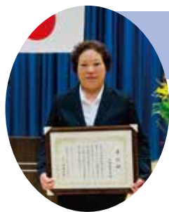
第30回三木町福祉大会 永年功労表彰