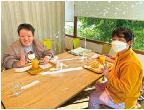
▲外出行事 おしゃれなカフェへ行きました