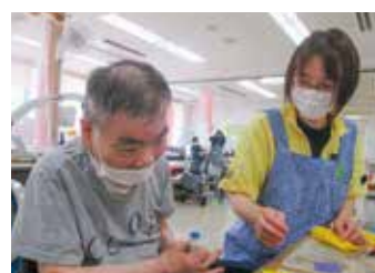
▲七夕飾りに願い事を書きました