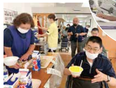
▲園内カフェでほっと一息（月2回）