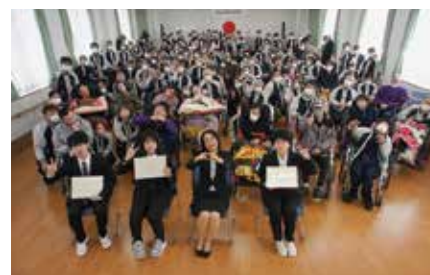
▲49 周年記念式典・さくら祭り