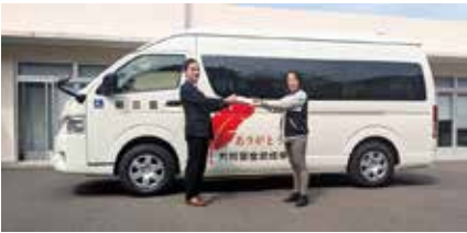
▲(社福) 香川県共同募金会様 ハイエース