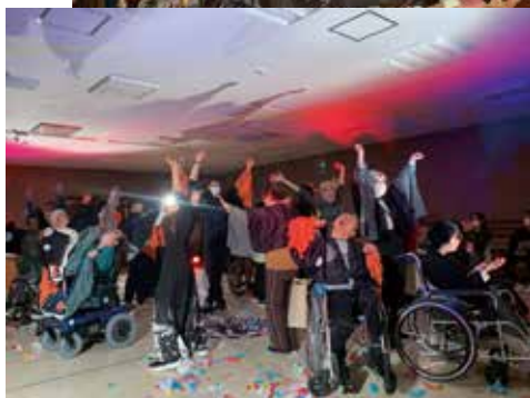
◀アートリンクダンス発表

朝日平成園生活介護は、利用者さんの身体機能維持・向上に力を入れています。特にボトルキャップを使った手指の運動は、指先の巧緻性や集中力を高める人気の活動です。楽しみながら手指を動かすことで、日常生活における動作の習得にも繋がり、利用者さんの自立をサポートしています。