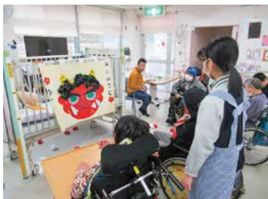
▲レクリエーション