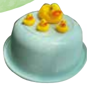
▲お風呂のおとも アヒルちゃん