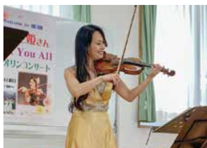
▲青柳妃姫様バイオリンコンサート