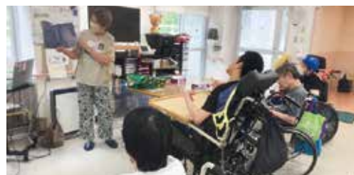
▲外部講師による読み聞かせ