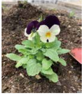
▲YKK AP(株)様 花の苗